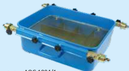
модель AOG 1004/1