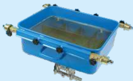
модель AOG 1004-P/1