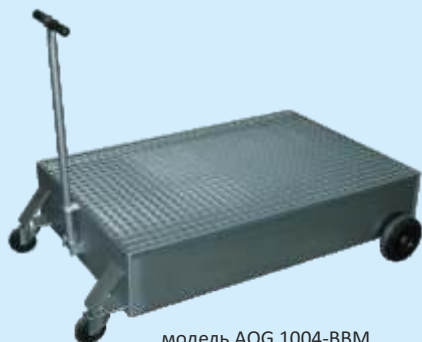
модель AOG 1004-BBM