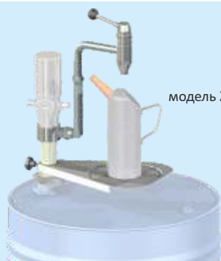
модель ZO 12