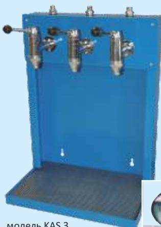
модель KAS 3