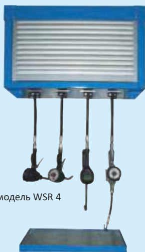
модель WSR 4