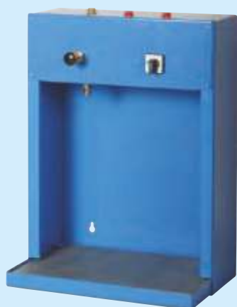
модель KAS 1/S